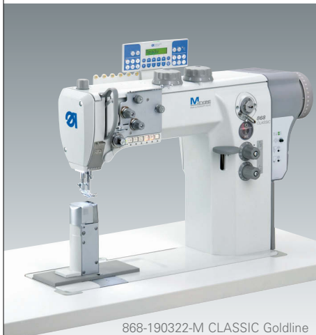
868-190322-M CLASSIC Goldline

868-290341-M CLASSIC Goldline: Twin needle lockstitch post bed machine without thread trimmer with XXL-hooks for the processing of thick sewing threads. Example of application: Topstitching of decorative piping seams with equal seam distance to ensure an effective seam appearance