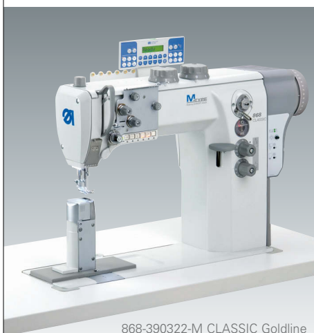
868-390322-M CLASSIC Goldline