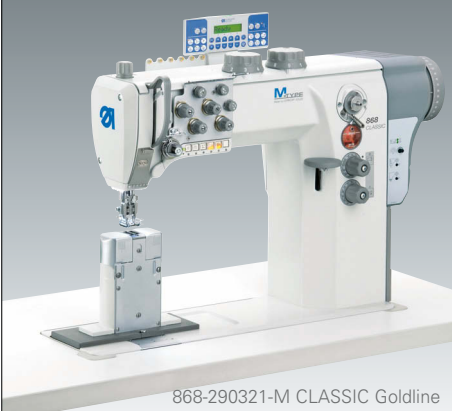
868-290321-M CLASSIC Goldline