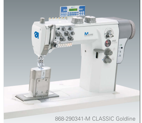
868-290341-M CLASSIC Goldline