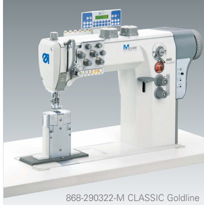
868-290322-M CLASSIC Goldline