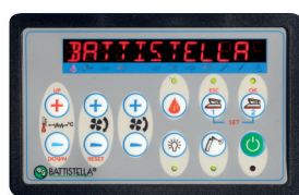
CONSOLE COMANDI CONTROL PANEL