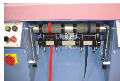
Tirapezza doppio con doppio tiraggio Take-down unit with double pull