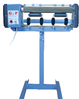
Estrattore mod. RUBINO Extractor mod. RUBINO