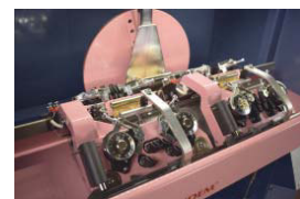
G&P Equip Tandem

Compact Knitting Machine for the production of strips (usually applied to knitwear as cardigan), of belts and scarves. Simple stitch selection allows even non-experts to use this machine with ease. All G&P EQUIP models are endowed with tensions to stop the carriage movement in the event of knots or broken yarn, needle-savers, built-in lighting, an effective take-down system for the knitting produced and a manual changer of speed. Each model is formed by a solid steel bench fitted with a complete safety system.