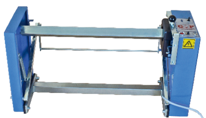
Avvolgitore mod. MINI Rolling up mod. MINI