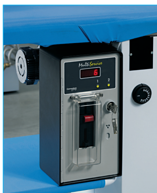
Gettoniera Coin mechanism

VACUUM IRONING BOARD WITH 1 IRON + BOILER