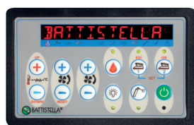
CONSOLE COMANDI CONTROL PANEL